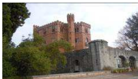
Panorama dai giardini del Castello di Brolio