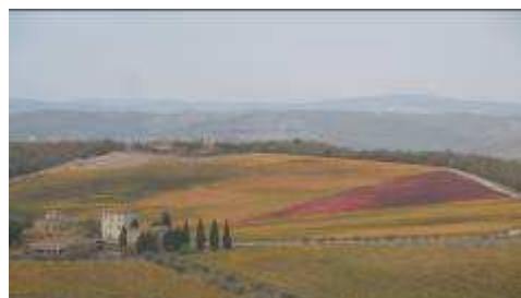
Pranzo da Sira e Remino a san Guscumè